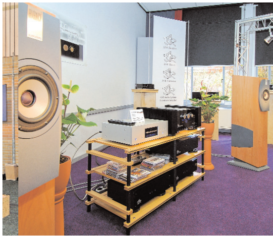
Audio Data (Avancé)